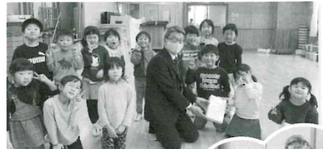
出雲崎こども園より募金