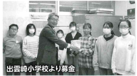
出雲崎小学校より募金

皆さまからお寄せいただきました募金は、全額を新潟県共同募金会に送金し、県民全体の施設や福祉事業、町内の高齢福祉事業などに有効に使われます。